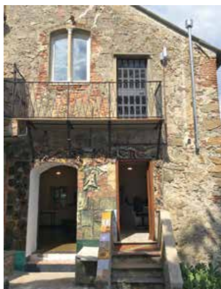
Asger Jorn, Vestsiden af atelier. Jorn havde atelier på første sal.

Det er her, det sker. I Albisola, den solbeskinnede by ved Middelhavet, ikke langt fra Savona har Asger Jorn fra 1957 til sin død i 1973 sin mest produktive periode. Her skaber han de to værker, som skal blive stående til evig tid med deres skønhed og deres provokation.