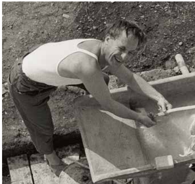
Asger Jorn, Jorn renser en blæksprutte.