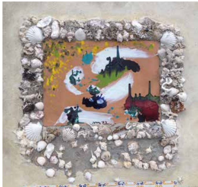
Asger Jorn, Privat foto.

>> og vitalitet er de bærende og naturlige tilgange og et samtidigt fundament for kunsten. Planlægning og ord flytter ikke noget, snarere vil de låse inspirationen fast og ødelægge den skabende proces.