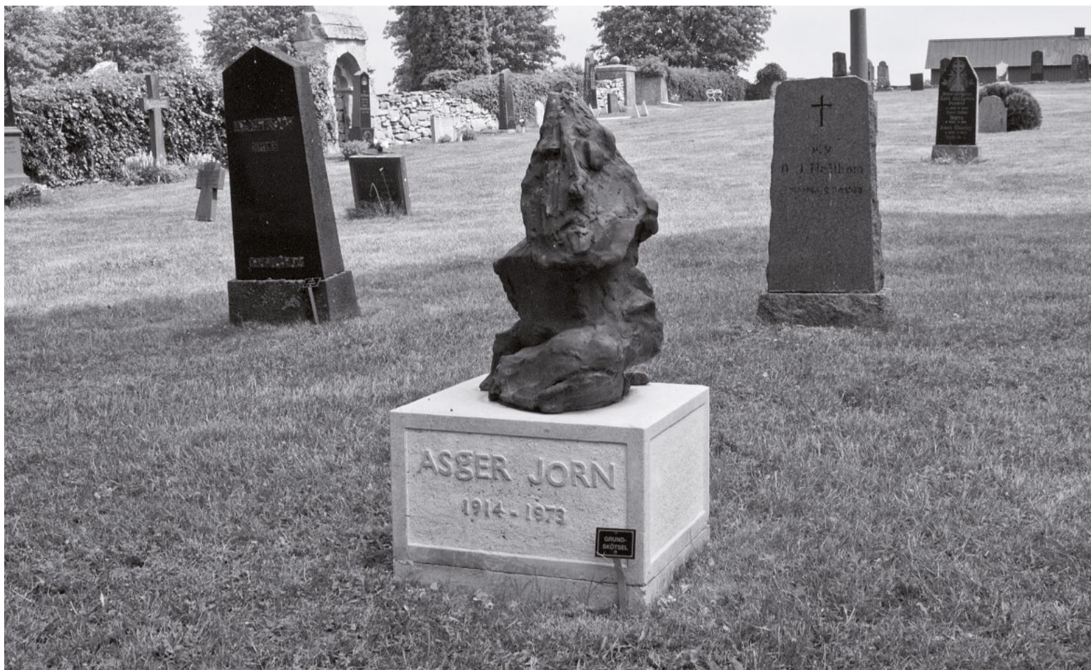
Den danska världskonstnären Asger Jorn ligger begravd i Grötlingbo. I boken får vi veta hur det gick till när han kom till ön under 1960-talet.